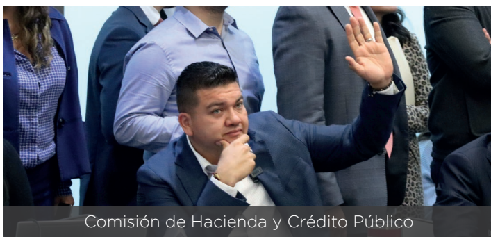
Comisión de Hacienda y Crédito Público